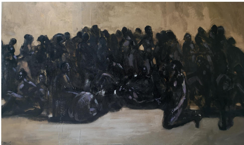
David Daoud, L'Attente , huile sur toile, 130x200 cm, 2020